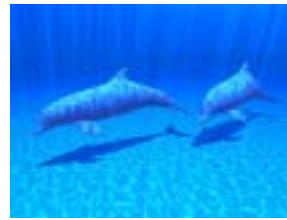
(a) 水中の光学的効果

グラフィックスハードウェアを利用して、水、髪、砂状物質等をリアルタイムに変形表示する研究を行っています。また、流体を考慮した風きり音の生成は、CGの新たな研究方向として期待されています。大気散乱光(空の色など)の色の高速表示や、肌のしわのインタラクティブな表示等も行っています。