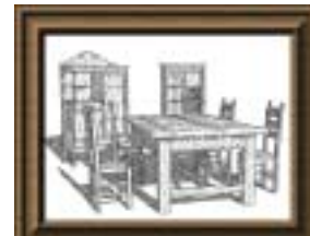
(c) ペンアンドインク風