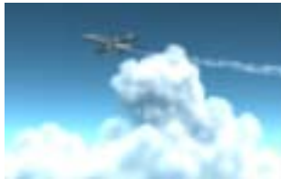
(b) 雲粒子の多重散乱光