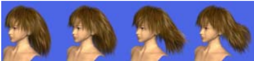
(c) 髪の毛のレンダリング