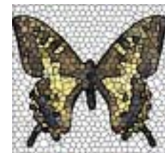
(b) ステンドグラス風